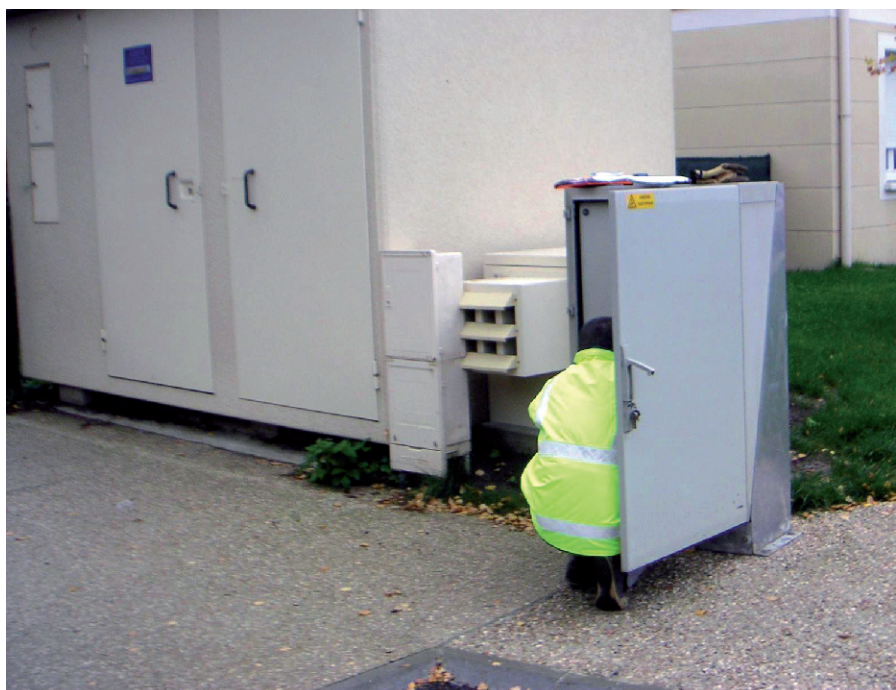
Des contrôles d'efficacité indépendants ont permis à une Communauté d'Agglomération d'optimiser la performance de ces traitements anti-H 2 S sur les postes de refoulement du réseau.