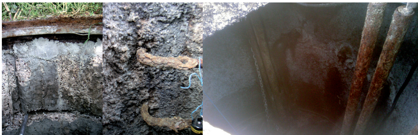
Regard de visite 20 ppm/1 an.

Les ouvrages d'assainissement et les équipements sont quant à eux confrontés en permanence aux effets dévastateurs de la corrosivité du gaz H 2 S. Contrairement à certaines idées reçues, même à de faibles concentrations, l'hydrogène sulfuré